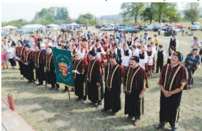
Kelemenelki szüreti ünnep