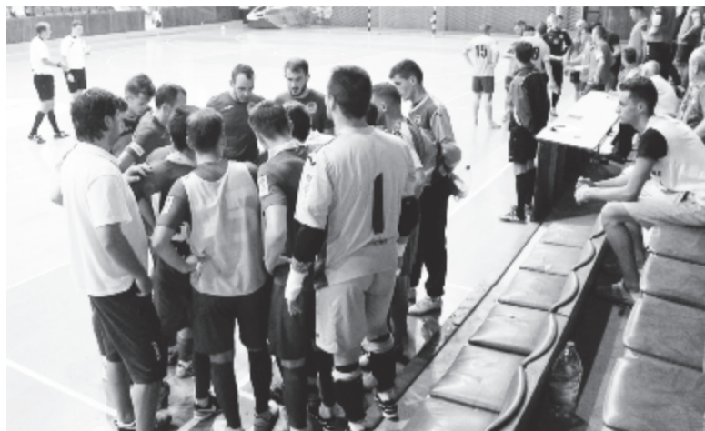
Ma már csak emlék a ligeti sportcsarnok: közvetlenül a Dunărea Călărași elleni mérkőzés rajtja előtt készítette ezt a felvételt munkatársunk. Tartozásai miatt a City'us a továbbiakban már nem veheti igénybe a sportlétesítmény szolgáltatásait, így az udvarhelyieket már a sportiskola termében látták vendégül.