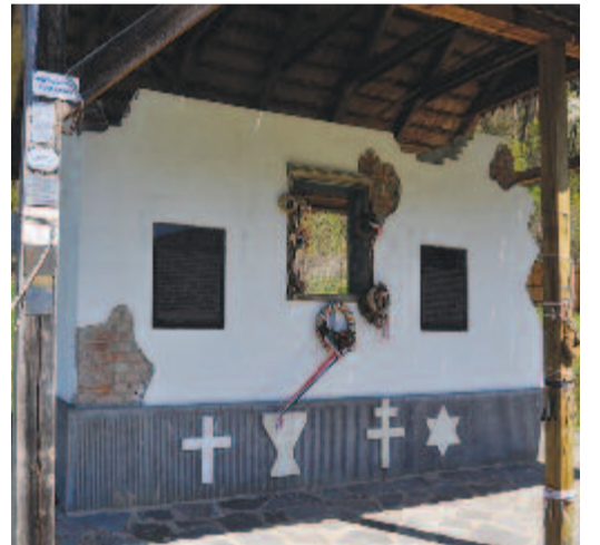
A bözödi „siratófal”

Ezeket a képződményeket Orbán Balázs halomsírokként említi a Székelyföld leírásában. 2009-ben és 2011-ben régészeti légifelvétel