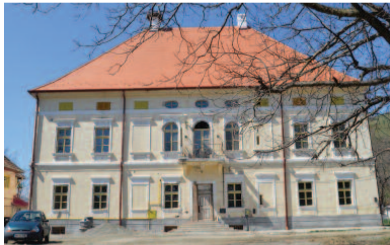
Az erdőszentgyörgyi Rhédey-kastély

Maros megye legkisebb lélekszámú és egyik legfiatalabb városa, egykor járási székhely volt. Bronz- és vaskori leletek igazolják, hogy a történelem előtti időkben lakott volt. A római korban itt vezetett el